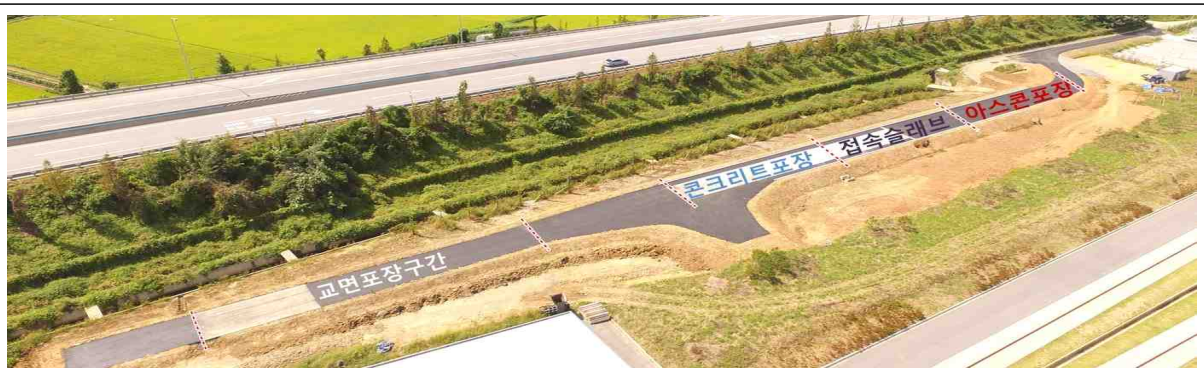
[시험도로 전경(교면포장, 콘크리트포장, 접속슬래브, 아스콘포장)]