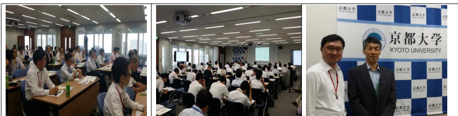
ISO5500X 워크숍 모습(Tokyo)