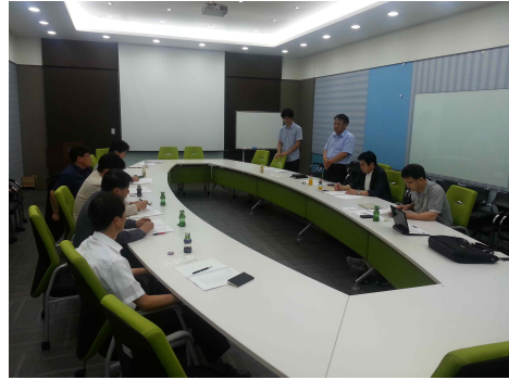
<도로환경전문연구위원회 - kick-off 회의 사진>