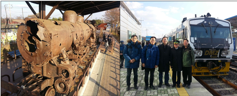
1950년 중단된 기차