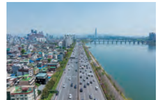
표지사진_ 서울 강변북로